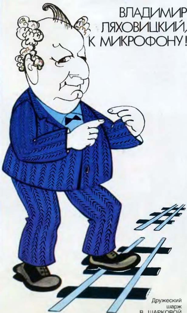
Дружеский шарж В. ШАРКОВОЙ