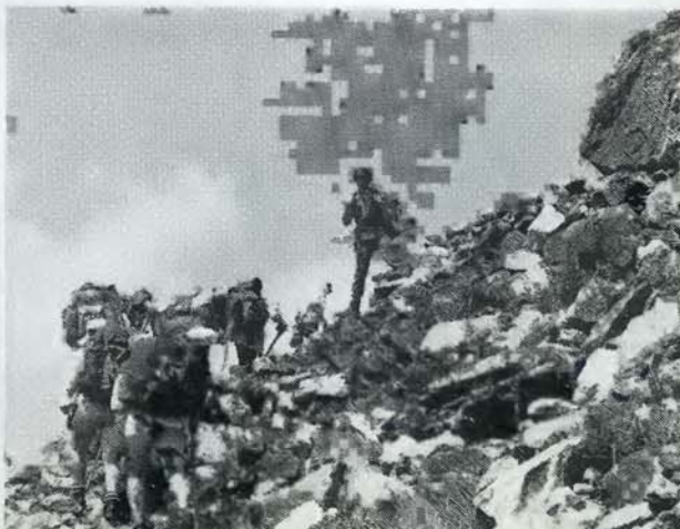
На фото автора — участники похода по маршруту «Оборонная тропа», 1988 г.